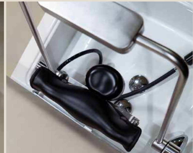
Salvacollo dedicato | Neckrest dedicated