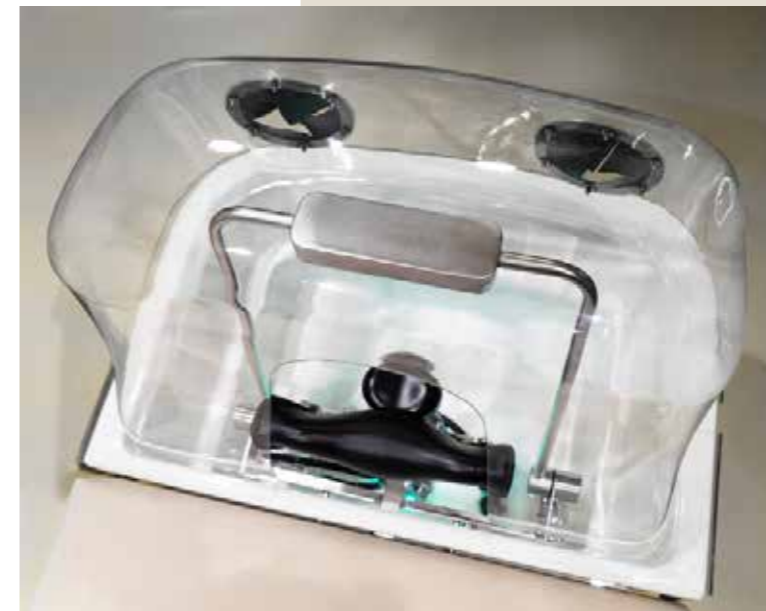
Calotta igloo | Igloo