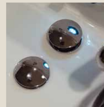
Doppio scarico per acqua e olio Double drain for water and oil