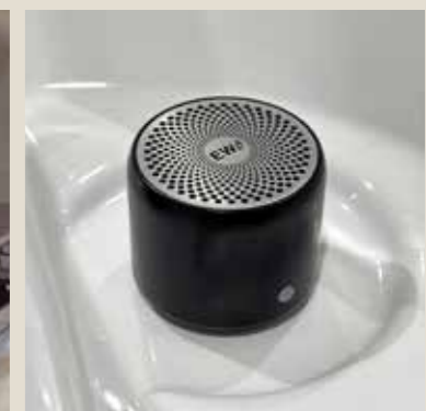
Musica | Music